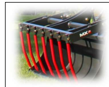
Mestvork klauw GFC120