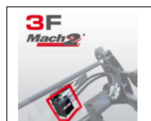
Mach 2 systeem