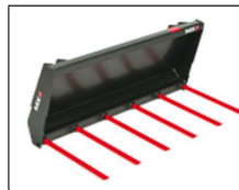
Mestvork 1,20 m