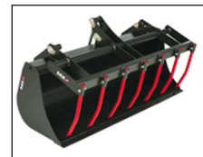
Multi-service bak 1,30 m