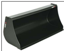
Bak 1,40 m