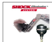
Schok eliminator systeem